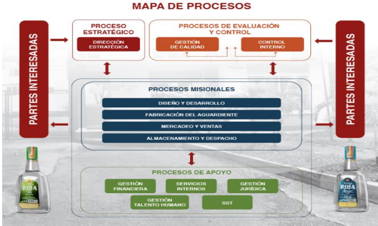
Ilustración 1 Mapa de Procesos (Ejemplo)

Se hace la descripción de alto nivel del mapa de procesos de la fábrica de licores del Tolima, el cual representa el comportamiento de está dando orientación al cómo gestiona las actividades para dar cubrimiento a su misión.