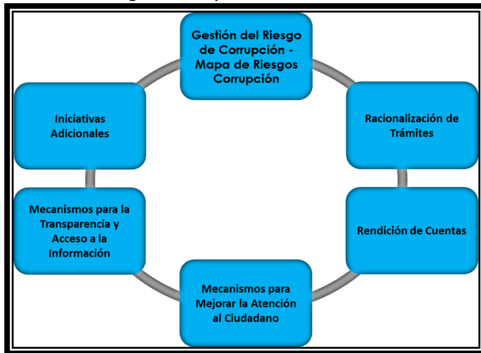
Imagen 1. Componentes